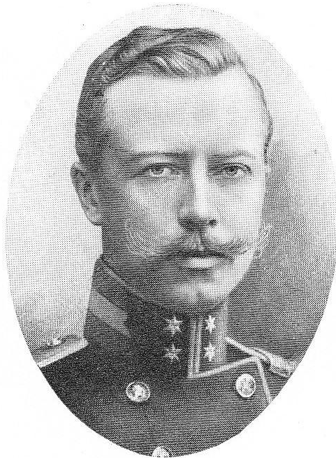
BERG, Honoré, né le 3 mai 1886, à Bevere-lez-Audenarde. Lieutenant. Ordre de Léopold; Croix de Guerre. Grèvement blessé le 22 octobre 1914 au cours de la bataille de l'Yser, à laquelle il participa avec vaillance; mourut des suites de ses blessures, le 27 octobre 1914, à l'hôpital militaire de Calais.