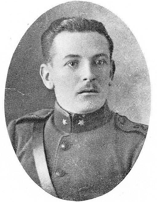
CHRISTIAENS, Remi-Auguste, né le 21 mars 1893, à Grammont. Lieutenant. Ordre Léopold; Croix de Guerre. Tombé en brave lors de la défense de la digue de l'Yser, succomba aux suites de ses blessures, le 13 août 1916, à Steenkerke.