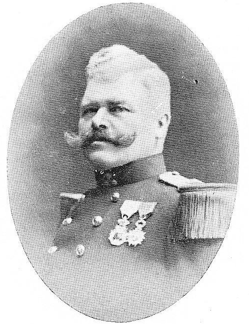
VERLOOVE, Oscar-Hippolyte, né le 9 mai 1870, à Gand. Capitaine-Commandant. Officier O. L.; Ordre de la Couronne; Croix de Guerre; Tombé en brave, le 18 août 1914, au milieu de ses soldats dans l'épique combat de Houthem-Sainte-Marguerite où le 2 me Régiment de ligne conquiert son premier fleuron de gloire.