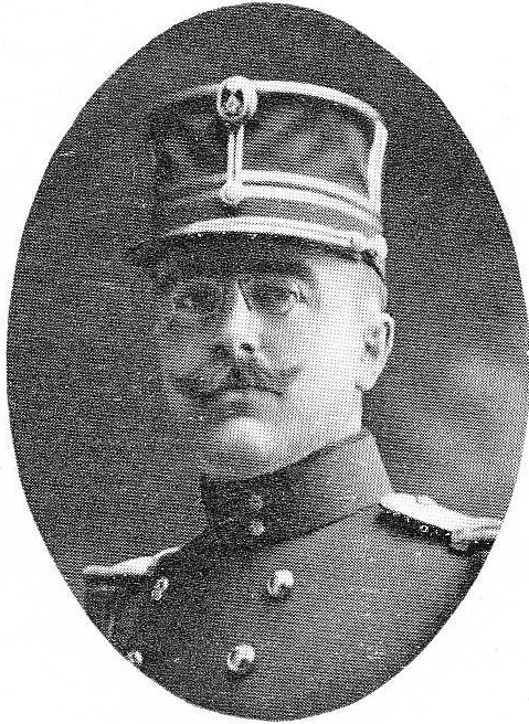
MARICHAL, Hector, né le 16 septembre 1877, à Gand. Capitaine-Commandant-Mitrailleur. Ord. de Léopold, Croix de Guerre, 1 citation. Tué le 2 octobre 1914 lors d'une contre-attaque des troupes belges contre le fort de Wavre-Sainte-Catherine, d'une balle en plein cœur en voulant secourir une compagnie encerclée.